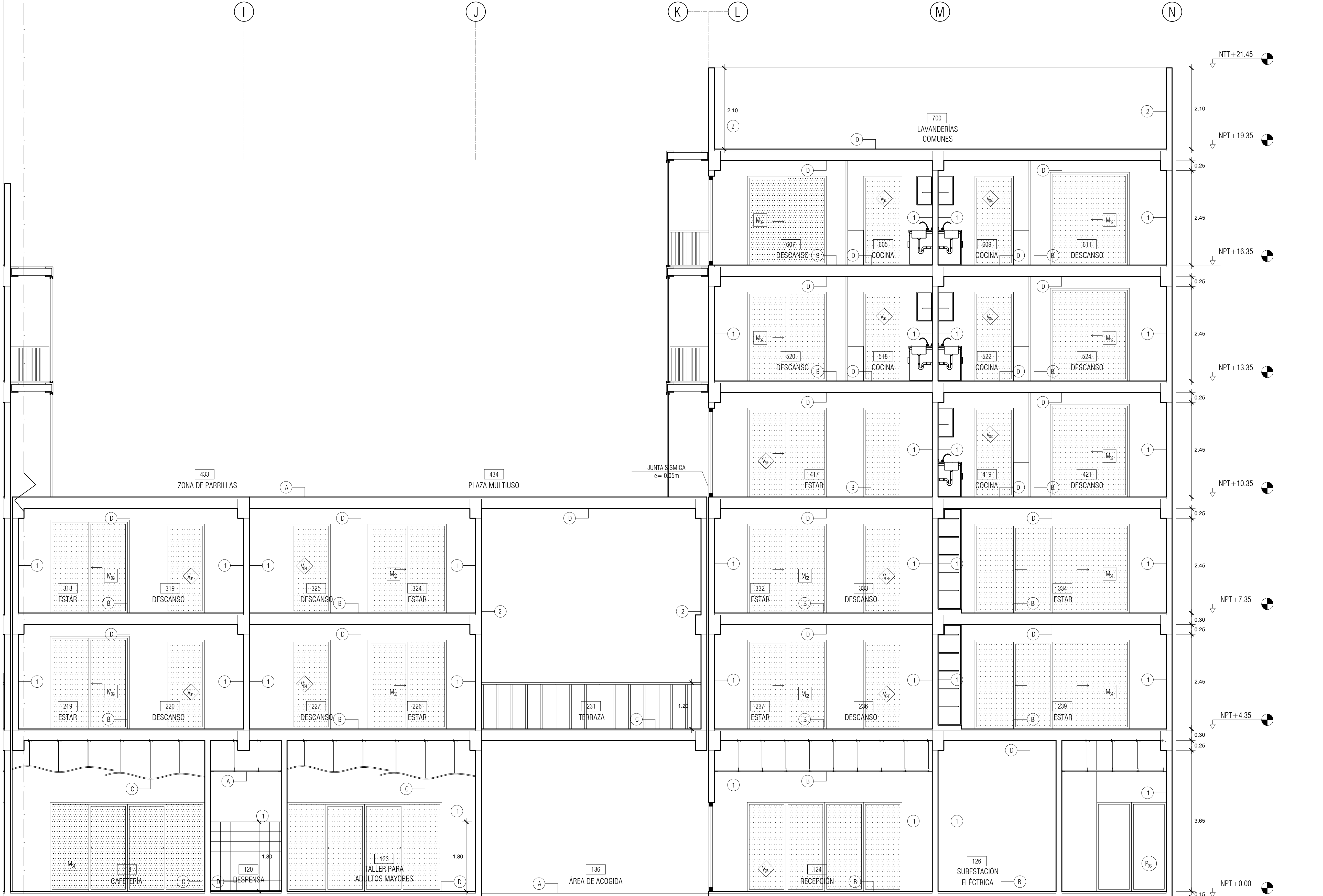
A CORTE A-A ESCALA 1/50

UBICACION: A 23/ 37 FECHA: SEPTIEMBRE 2019 LAMINA: A-23